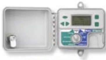
ET System Modul