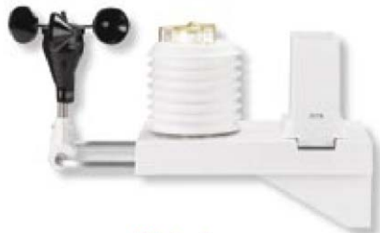
ET System Sensor (Mit optionalem Windsensor)

Optimieren Sie Ihre Bewässerung, indem das lokale Mikroklima verfolgt und automatisch ein wirtschaftliches Bewässerungsprogramm kalkuliert wird!